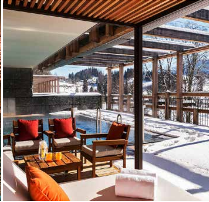
5 Waldhotel Health & Medical Excellence, Bürgenstock Platz 5 in der Kategorie «Gesundheitstempel»: Ist auf gutem Weg, dem Grand Resort Bad Ragaz das Wasser abzugraben.