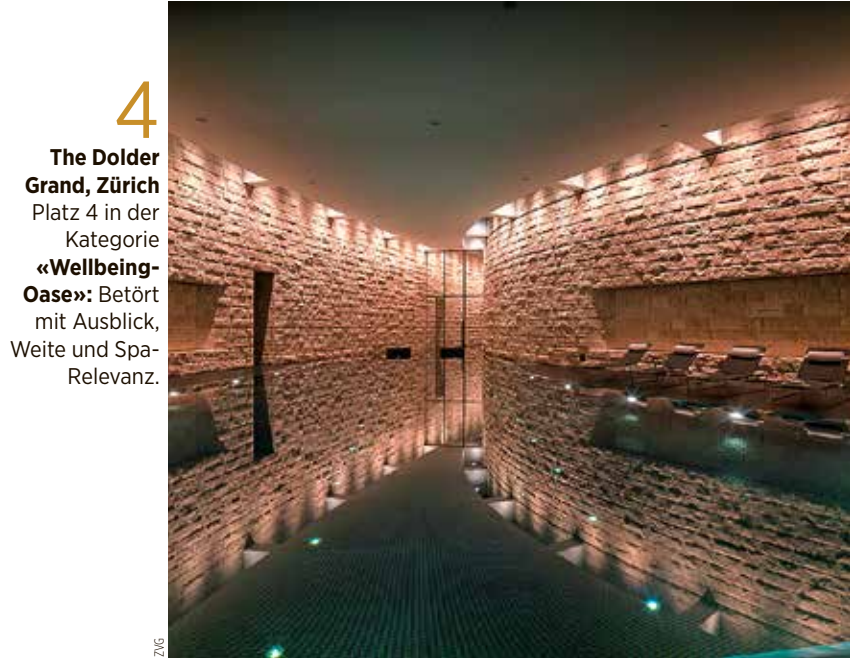
4 The Dolder Grand, Zürich Platz 4 in der Kategorie «Wellbeing-Oase»: Betört mit Ausblick, Weite und Spa-Relevanz.